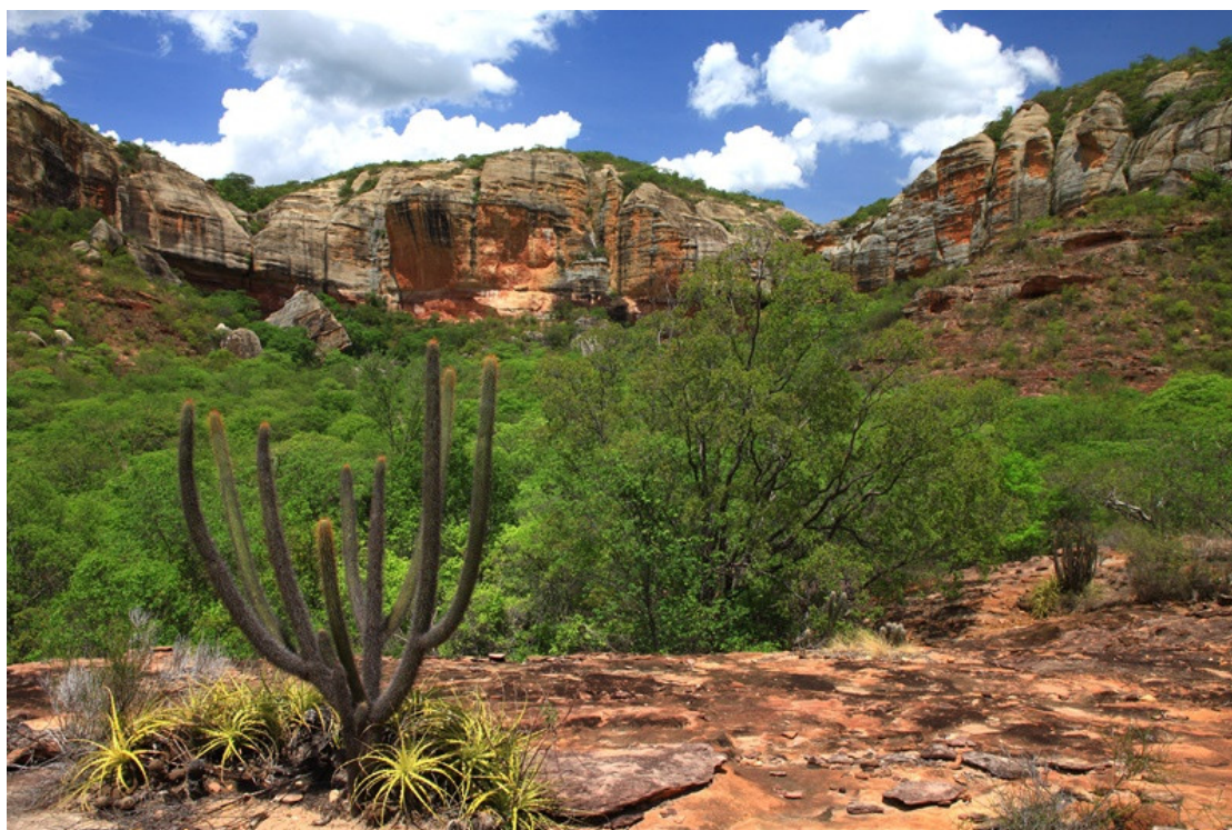
Parque Nacional Serra da Capivara (PI).

A Caatinga é um grande ecossistema de floresta seca , que recobre cerca de 11% do território brasileiro. Botanicamente, é considerado o único bioma