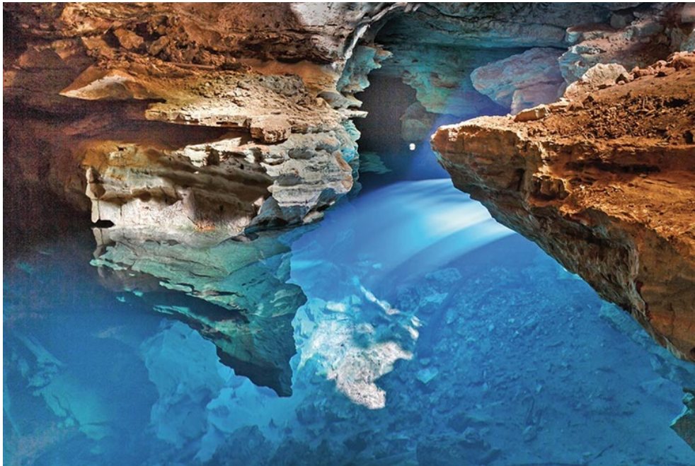
Chapada Diamantina, uma das unidades de proteção integral da Caatinga.

As unidades de conservação representam uma das soluções mais urgentes para garantir a sustentabilidade dos processos ecológicos da Caatinga e a manutenção da diversidade das espécies biológicas, evitando o aumento da desertificação.